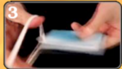
3 Gummibänder umschlingen