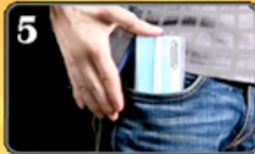
5 und Hosentasche!