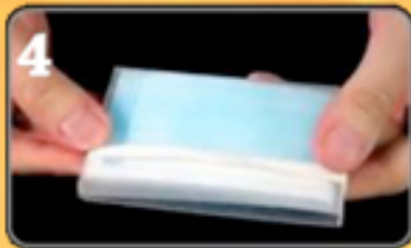
4 Fertig für die Jacken-.....