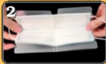
2 Maske einlegen und falten